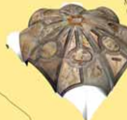
Modello 3D texturizzato