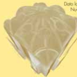
Dato laser scanner Nuvola di Punti